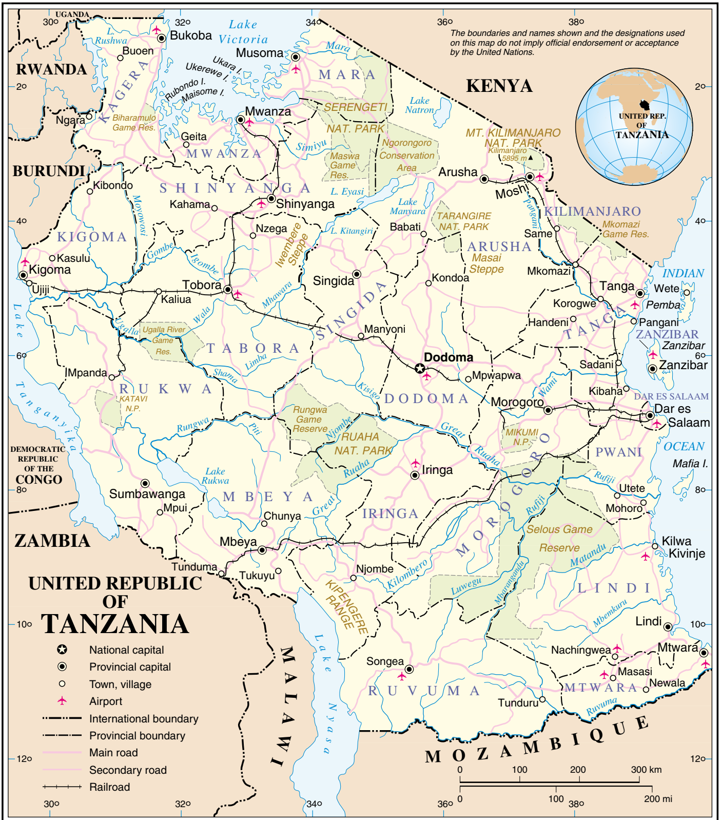
Map No. 3667 Rev. 6 UNITED NATIONS January 2006

Department of Peacekeeping Operations Cartographic Section