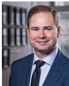
Nicolai Wammen Finansminister

Jeg vil gerne kvittere for det store engagement, der har omgivet arbejdet med denne handlingsplan. Tak til alle jer, der har givet bidrag og delt ud af jeres viden. Det samarbejde vi har haft, og fortsat vil have, er værdifuldt. For vi kan ikke løse den store opgave, som Verdensmålene repræsenterer, alene. Vi er nødt til at stå sammen.