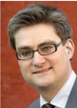
Søren Pind Udviklingsminister

Igen blev det forgangne år et begivenhedsrigt år for Udenrigsministeriet med store globale udfordringer og intern omstrukturering i ministeriet. Trods udfordringerne har ministeriet nået mange vigtige milepæle. Her skal nævnes nogle enkelte hovedopgaver blandt de mange, der har præget det forgangne år.