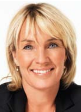
Lene Espersen Udenrigsminister