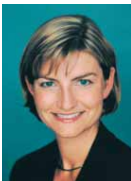
Ulla Tørnæs Udviklingsminister

Globaliseringens udfordringer og muligheder stod centralt i dansk udenrigs- og udviklingspolitik i 2006.