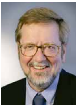
Per Stig Møller Udenrigsminister