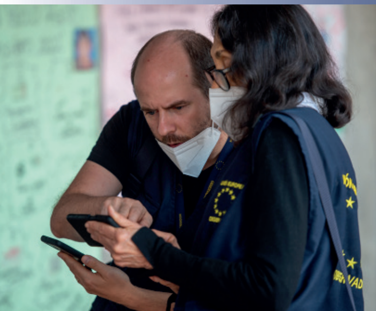
EU-valgobservationsmission i Colombia 2022.

Der udbræder krig i Ukraine, og missionerne SMM og EUAM evakueres.