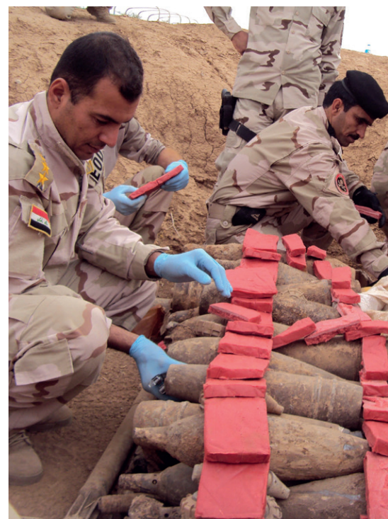
NATO Mission Iraq.