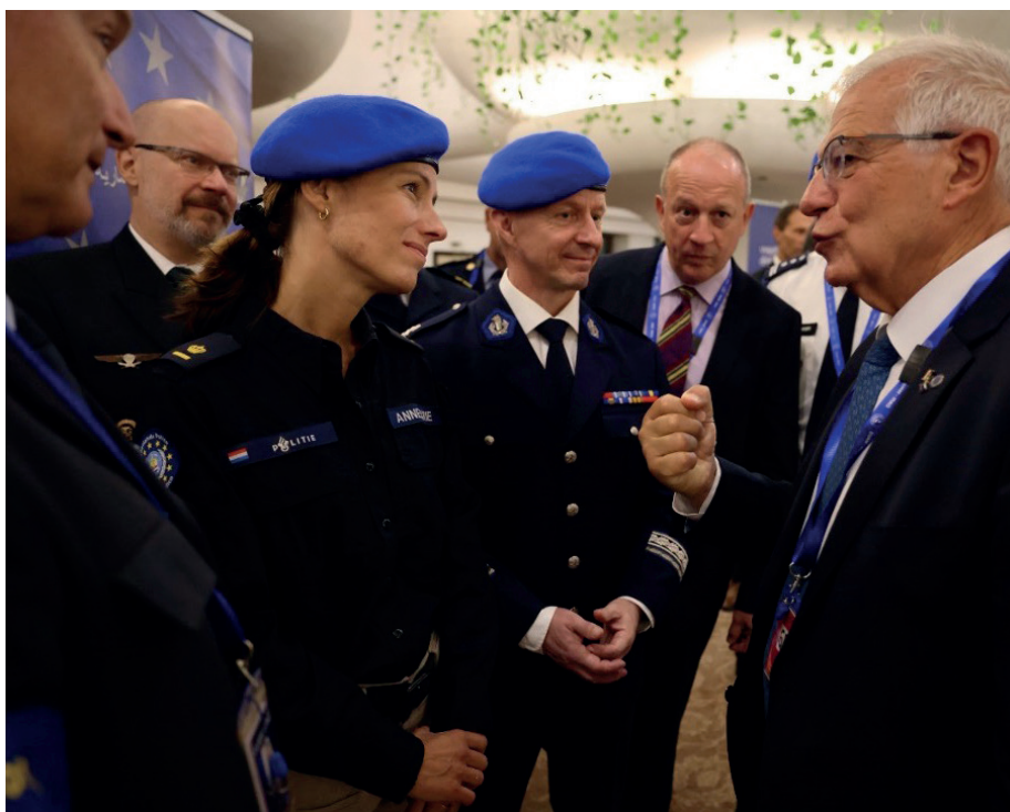
Rådgivningsmissionen EUAM Iraq blev oprettet i 2017.