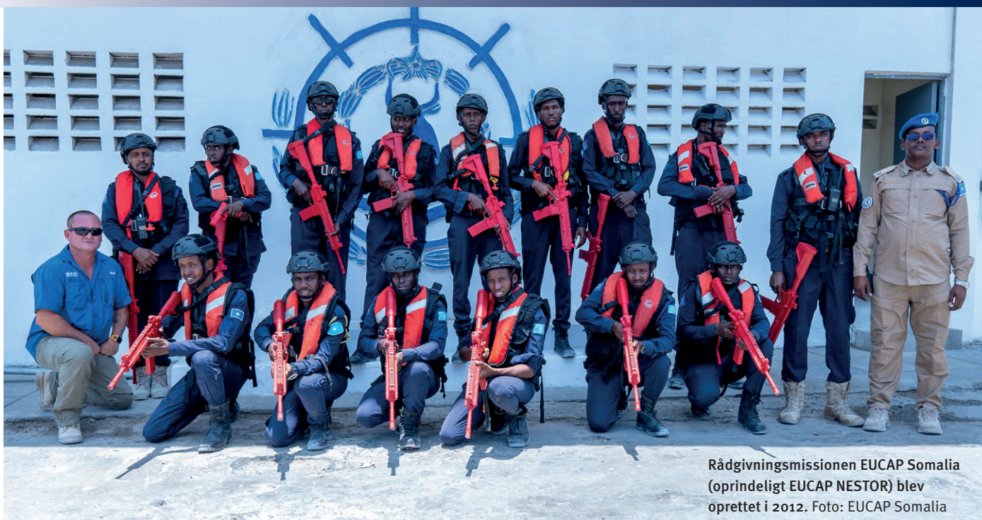
Rådgivningsmissionen EUCAP Somalia (oprindeligt EUCAP NESTOR) blev oprettet i 2012.

NIRAS overtager udsendelsen af eksperter til OSCE's Special Monitoring Mission Ukraine (SMM) på vegne af UM's naboskabskontor, EUN.