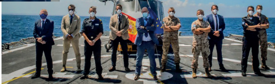
Rådgivningsmissionen EUCAP Somalia har p.t. 4 FSB'ere udsendt.