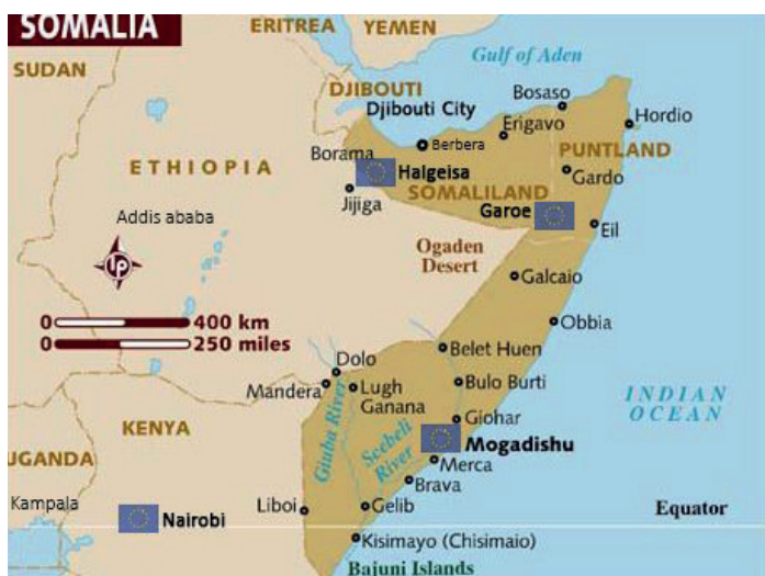
Kort: EUCAP Somalia