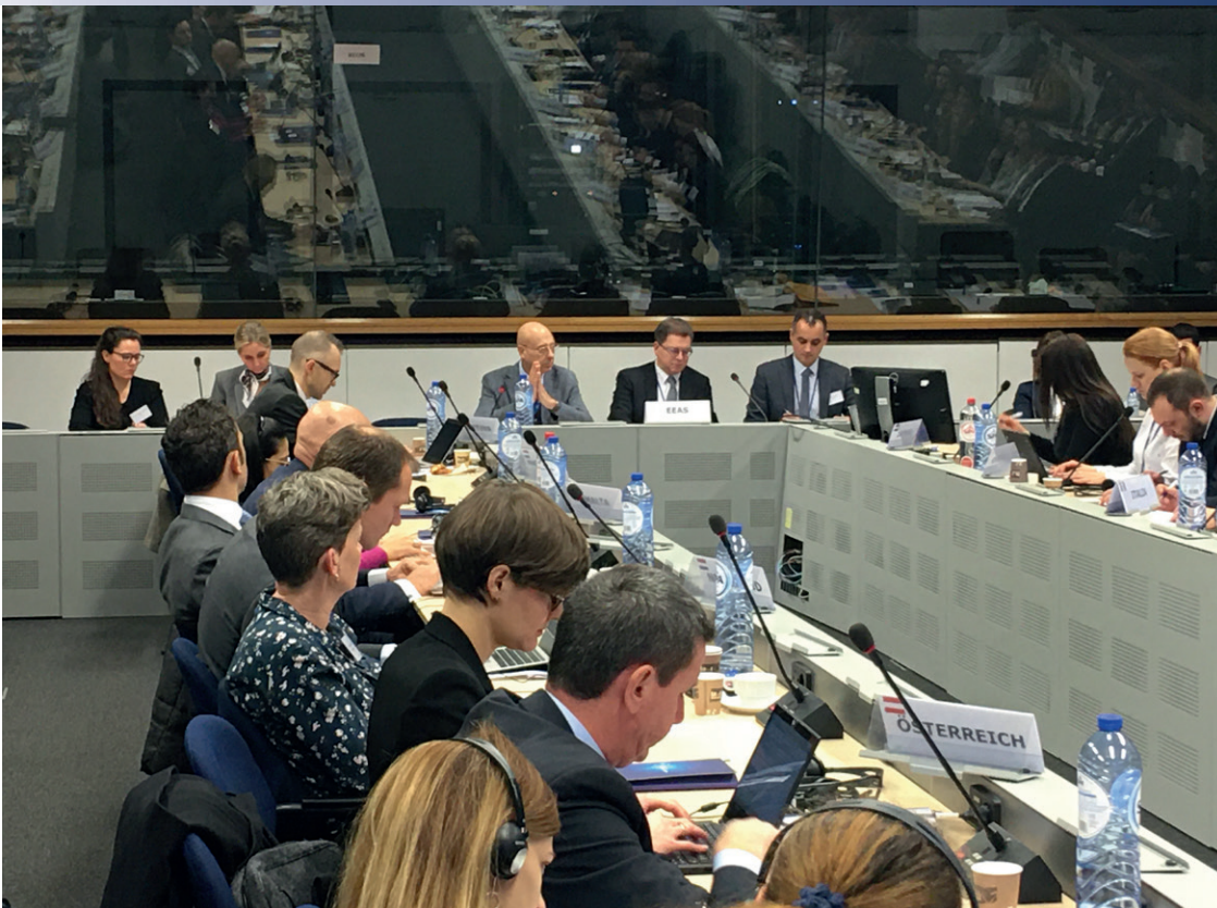
Katrine Aagaard, som sidder bagest tv, deltog sammen med nogle fra FSB-teamet i den årlige CSDP Human Resource-konference i Bruxelles den 10. december 2019.