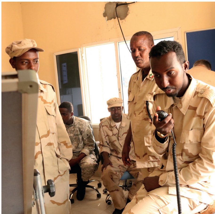
Rekrutter fra Somalilands kystvagt lærer at betjene skibsradio i kystvagtens kontrolcenter. Sikkerhed på et internationalt niveau omkring havnen i Berbera er vigtig for både investeringer og udvikling af havnen – som er Somalilands livsnerve, da stort set alle regionens aktiviteter foregår herigennem.

En anden succes for Hargeisa-kontoret er, at det er lykkedes at skaffe en større bilateral donation.