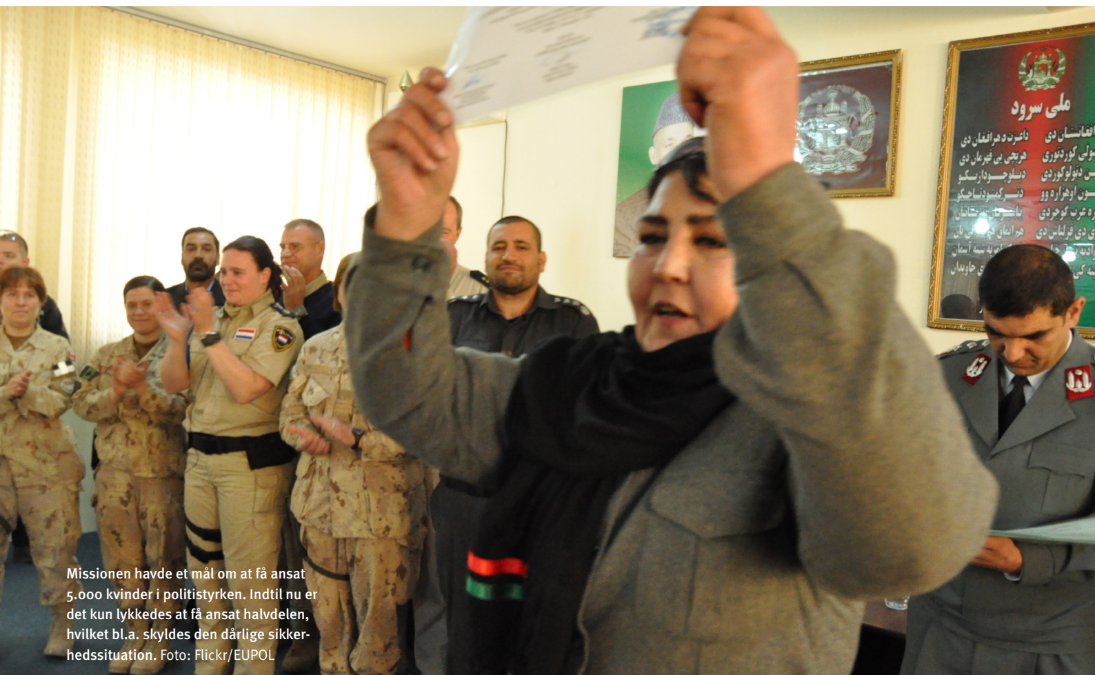
Missionen havde et mål om at få ansat 5.000 kvinder i politistyrken. Indtil nu er det kun lykkedes at få ansat halvdelen, hvilket bl.a. skyldes den dårlige sikkerhedssituation.