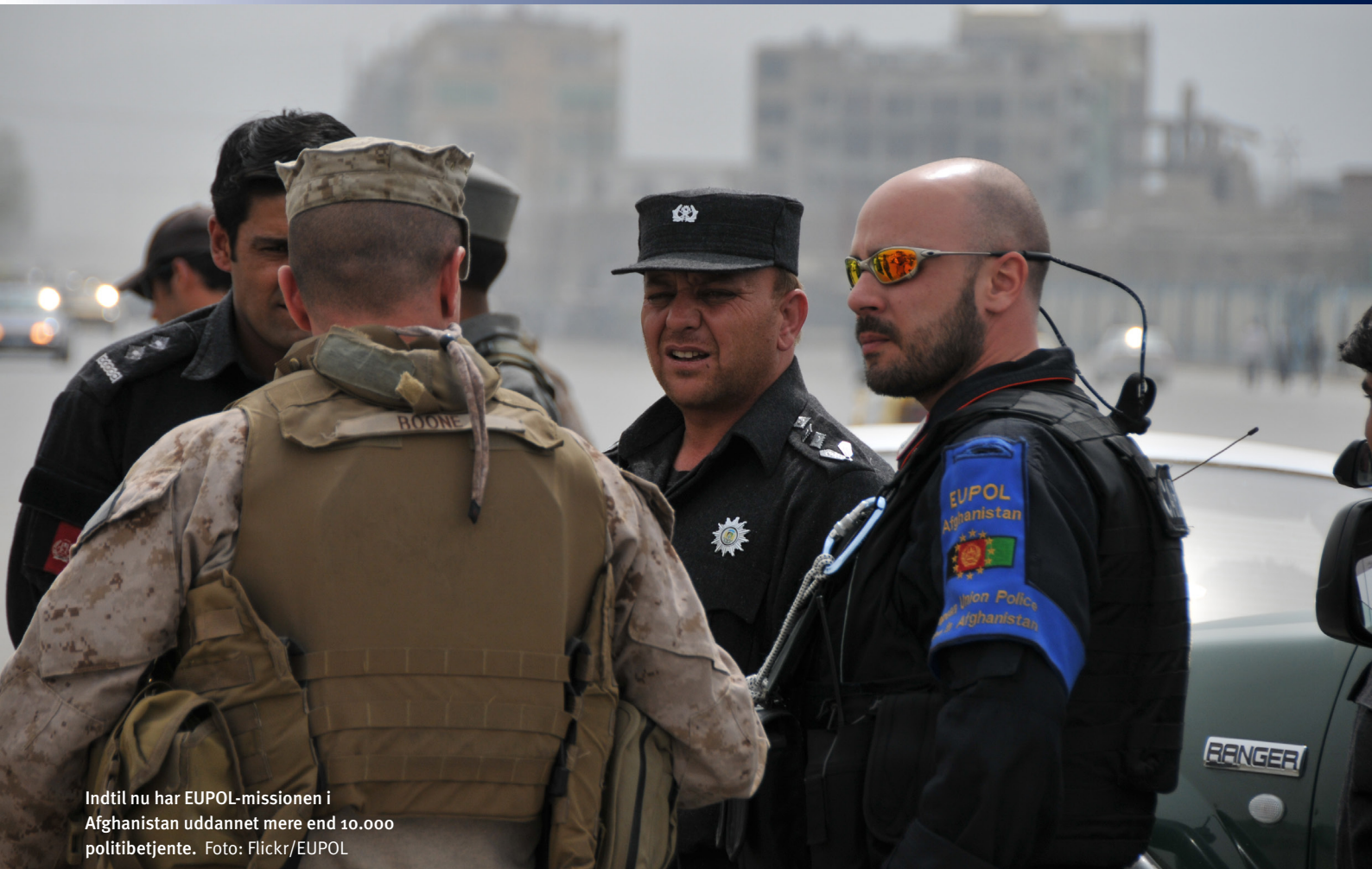
Indtil nu har EUPOL-missionen i Afghanistan uddannet mere end 10.000 politibetjente.

”Afghanistan er ifølge Transparency International stadig et af de mest korrupte lande i verden. Og en ny undersøgelse foretaget af et uafhængigt afghansk organ har vist, at det næststørste problem i Afghanistan – efter sikkerhedssituationen – er korruption. Dertil kommer, at befolkningen har allermindst tillid til netop politifolk, anklagemyndighed og domstol.”